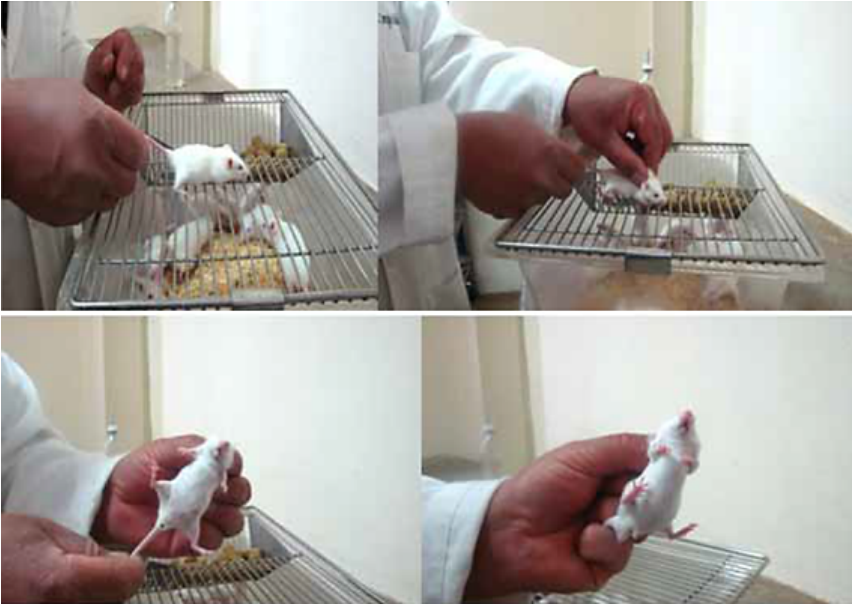
Figura 1. Procedimiento de toma, sujeción y manejo de Ratón